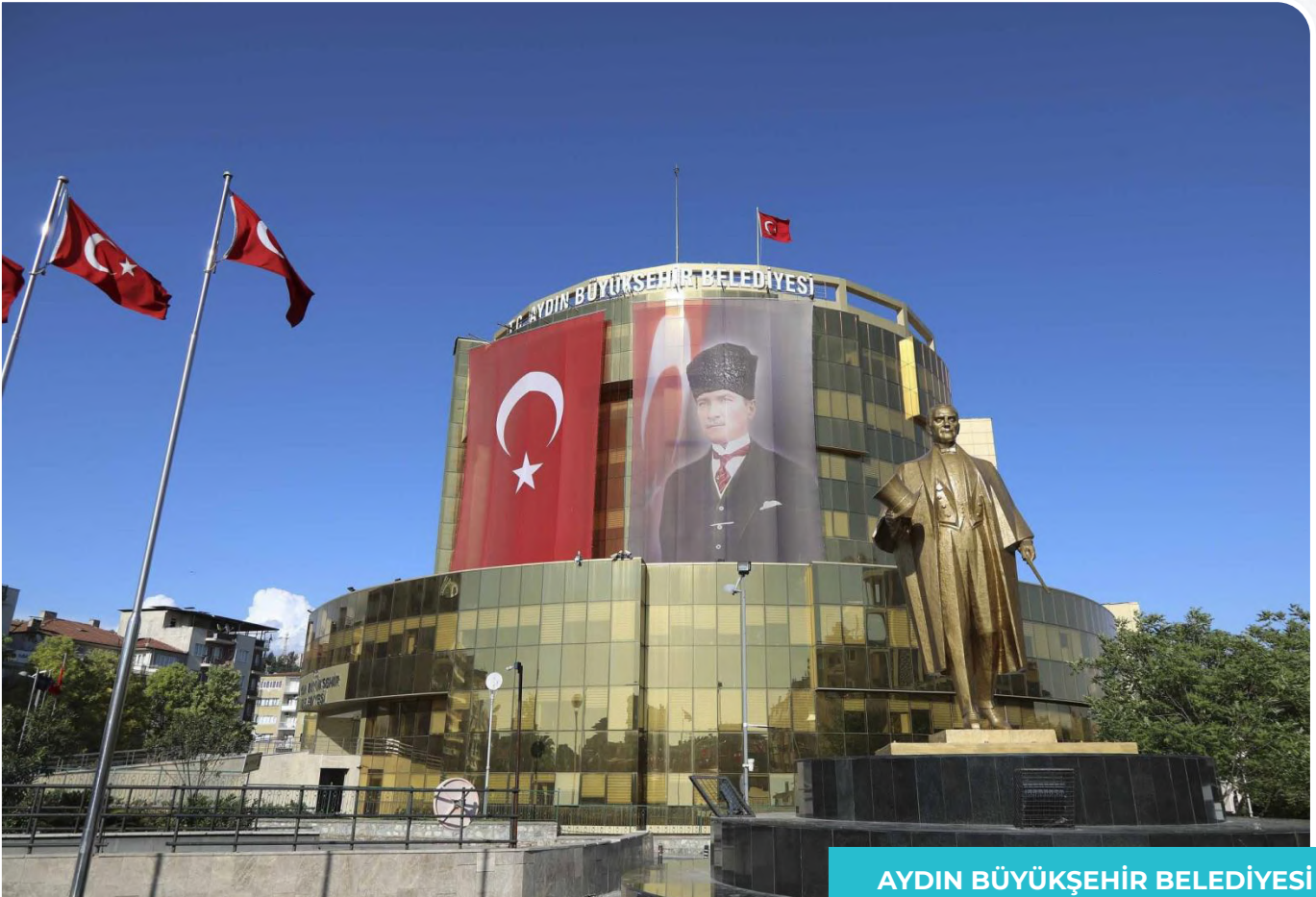
AYDIN BÜYÜKŞEHİR BELEDİYESİ